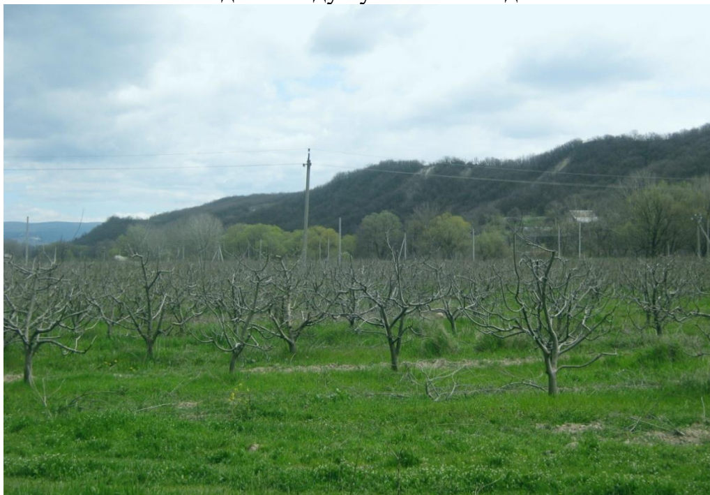
Сад в настоящем

Всматриваясь в будущее, я вижу знакомое незнакомое село: ровные ряды садов с современными гидротехническими сооружениями, навигационными системами и беспилотными технологиями. Сейчас это звучит фантастически, но я наблюдаю, как роботы собирают и сортируют плоды, а дроны, похожие на гигантских насекомых, орошают деревья. Но полноценные хозяева здесь все же люди, которые умело управляют современной техникой и вкладывают душу в любимое дело.