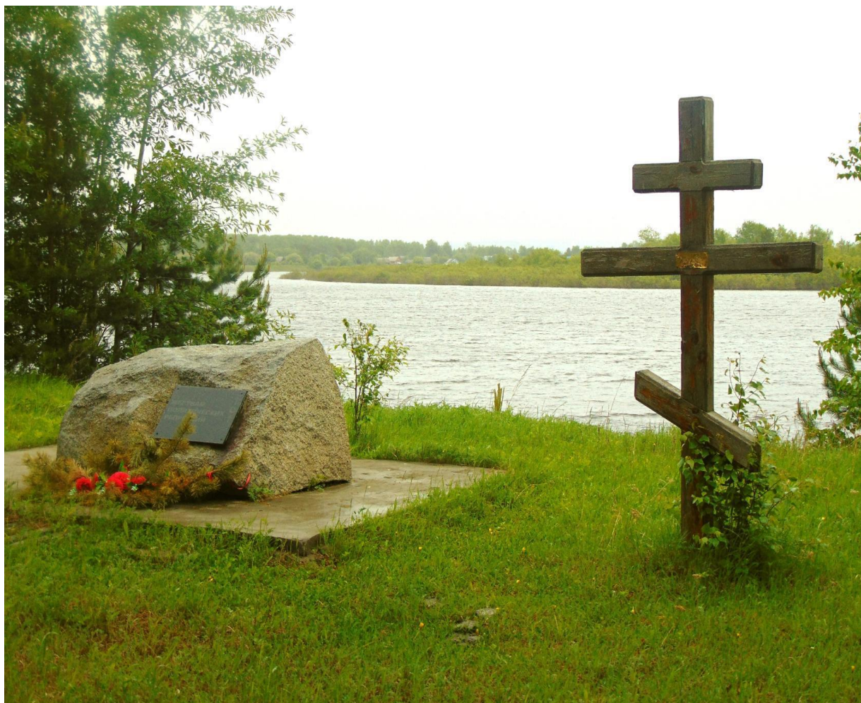
«Памяти жертвам репрессий 1930-1940-х гг»