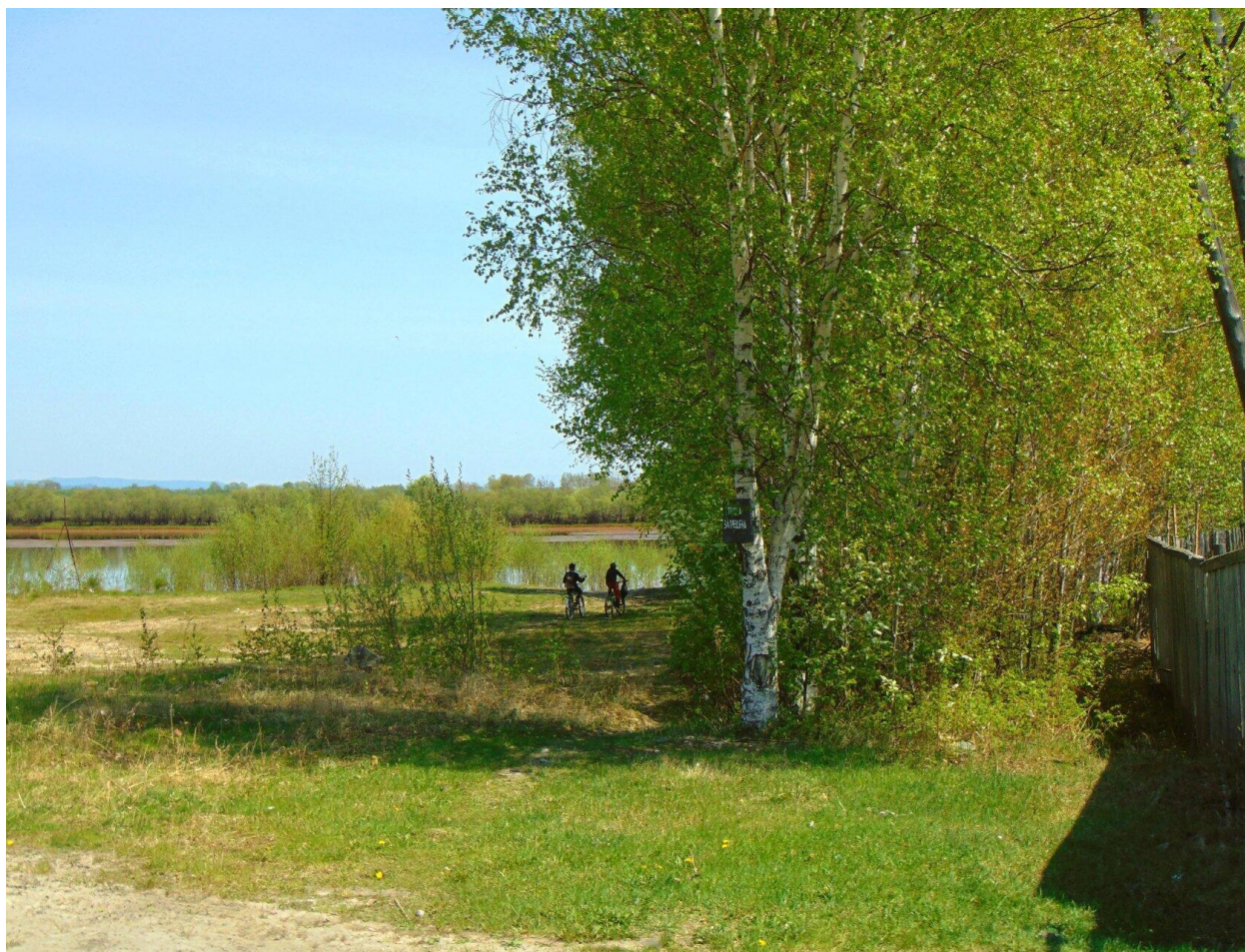
Берег реки «Амгунь»