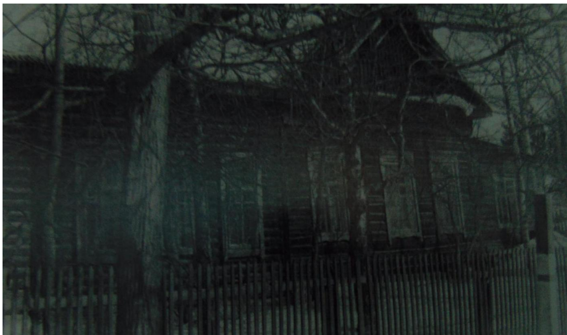
Старое здание больницы с. им. Полины Осипенко (тогда с. Керби)