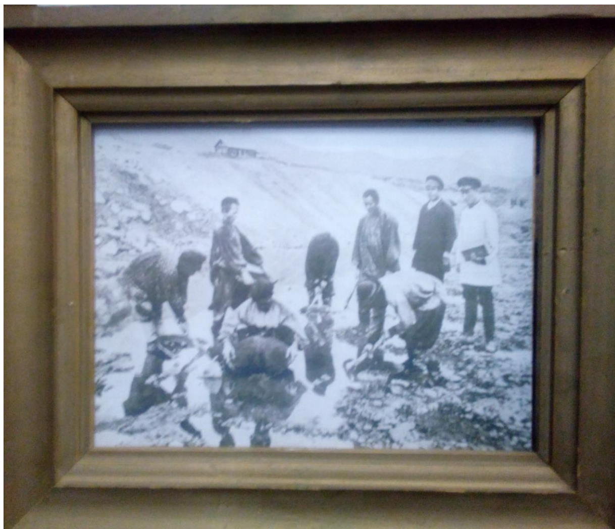
«Золотодобыча в Приамгунье» 1873 г.