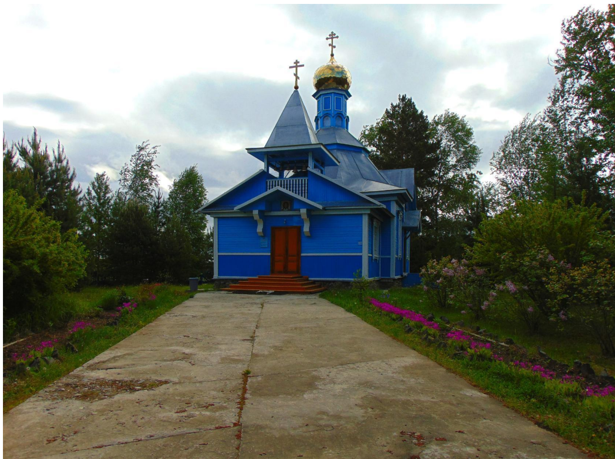
Храм Боголюбской иконы божей матери