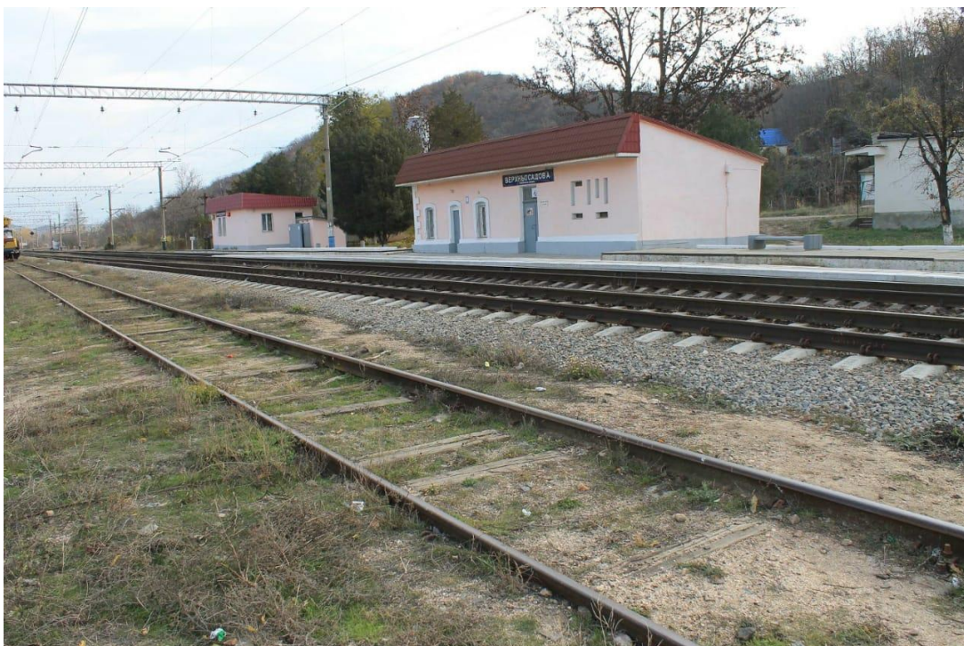
Станция «Верхнесадовая» сейчас

Но очень скоро будут проложены новые железнодорожные маршруты по Крымскому мосту, и модернизированные поезда начнут курсировать в Севастополь, останавливаясь на ожившей и преобразившейся станции «Верхнесадовая», где, как и в былые времена, проезжающие смогут купить свежие плоды, пахнущие солнцем, счастьем и детством.