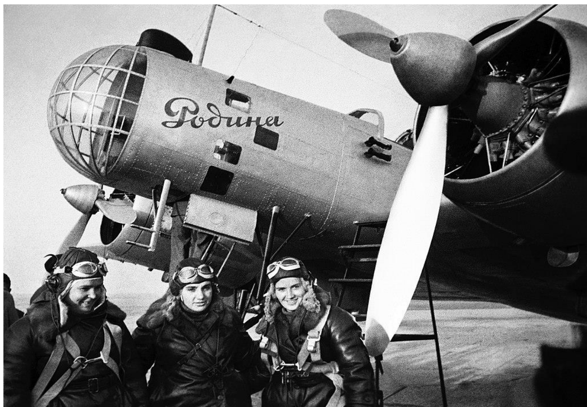
Экипаж самолёта АНТ-37 «Родина». 1938 г.

Сличая с картой очертания берега, штурман Раскова доложила командиру корабля Гризодубовой о том, что они находятся над Тугурским заливом. Полётное задание было выполнено. В. С. Гризодубова принимает решение повернуть самолёт к югу и посадить его в Николаевске. Сплошная облачность не позволила экипажу сделать посадку, решили лететь до Комсомольска. При снижении над Амуром экипаж увидел разветвляющиеся реки. Приняв Амгунь за протоку Амура, экипаж стал лететь над Амгунью. Поняв свою ошибку, взяли курс на Комсомольск над Амгунью и Чукчагирской низменностью.