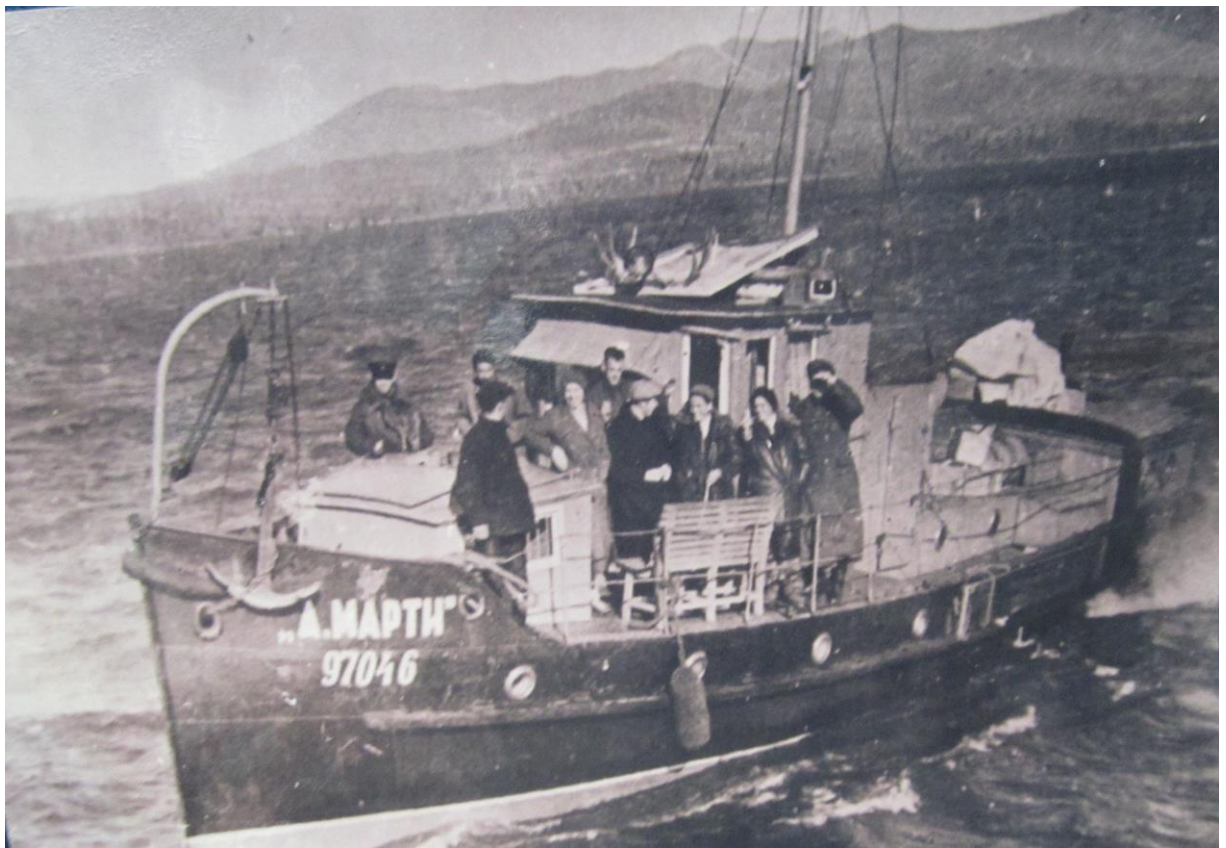
«Прощание с рекой Амгунь». На фото экипаж самолёта «Родина». 1938 г.

В сентябре 1938 г. к месту посадки самолёта «Родина» была направлена из Керби рабочая бригада из 30 человек. Из Комсомольска туда приехали авиационные специалисты. На мари срубили кочки, выровняли площадку и сделали временный аэродром. 4 декабря 1938 г. самолёт «Родина» был поднят в воздух и доставлен в Комсомольск. После ремонта его отправили в Москву. Он послужил как военный самолёт в годы Великой Отечественной войны. В последние годы, несмотря на просьбу В. С. Гризодубовой, самолёт пошёл на слом. Ныне никого из членов экипажа «Родины» и награждённых кербинцев не осталось в живых.