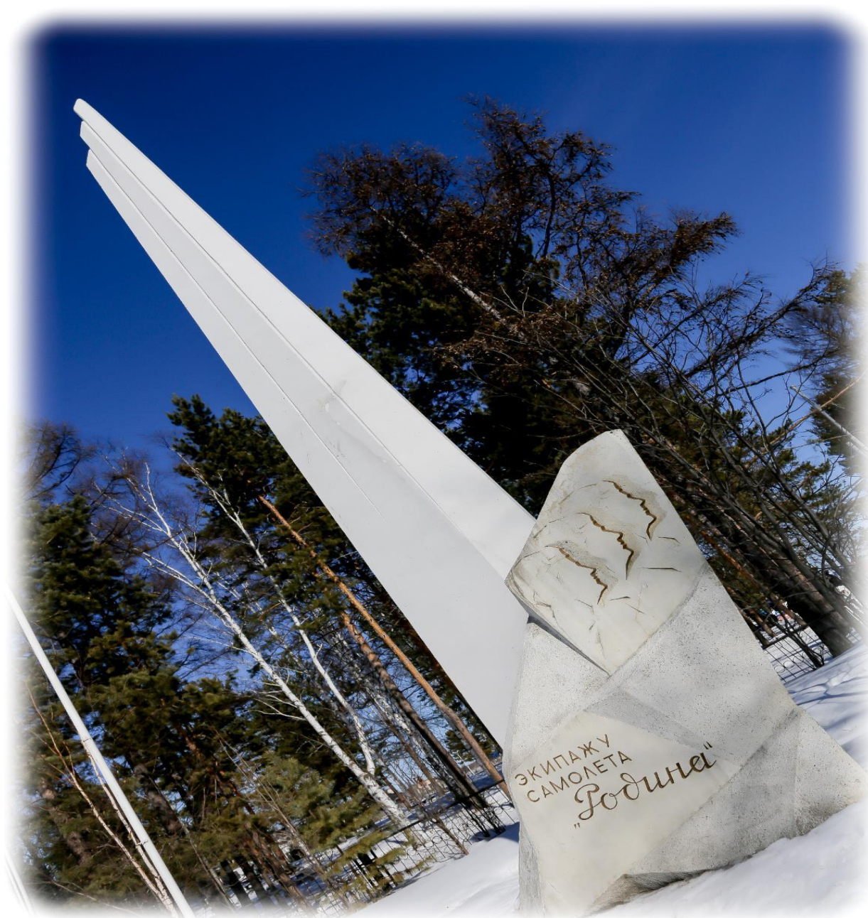
Памятник экипажу самолета «Родина»