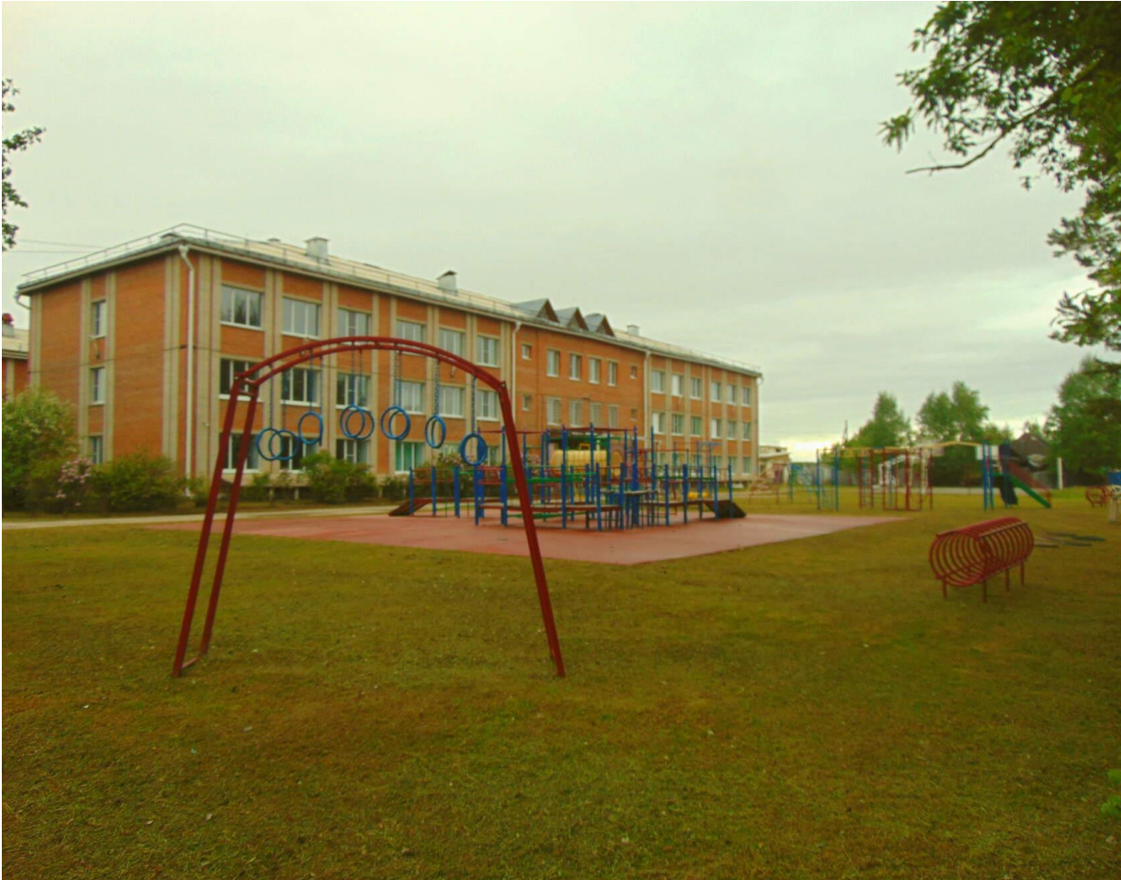
Школа с.им. П.Осипенко 2020г