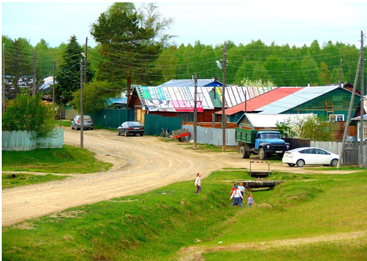
Улица 40 лет Победы