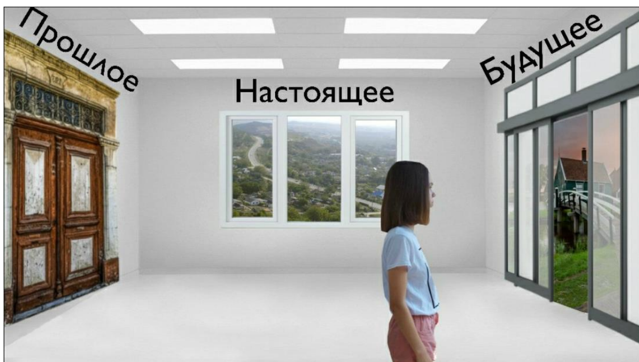
На фото автор работы

Оглядываясь в прошлое, я делаю решительный шаг вперед, и передо мной распаивается дверь в будущее. Каково оно, будущее моего села Верхнесадового (до 1945 г. Дуванкоя), затаившегося за грядой крымских гор в окрестностях Севастополя?