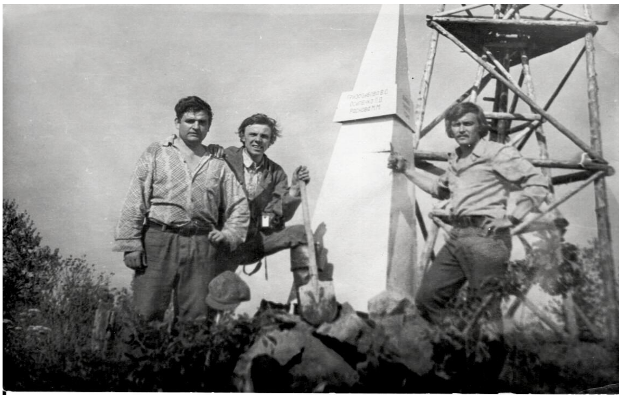
Установка памятного знака на сопке Юкачи, неподалеку от места посадки самолёта Родина.

Как только было получено известие о гибели Полины, в селах Кербинского района прошли собрания и митинги. Жители высказывали единодушное мнение: увековечить память героини и просить переименовать район, присвоив ему имя Полины Осипенко. Просьба была удовлетворена.