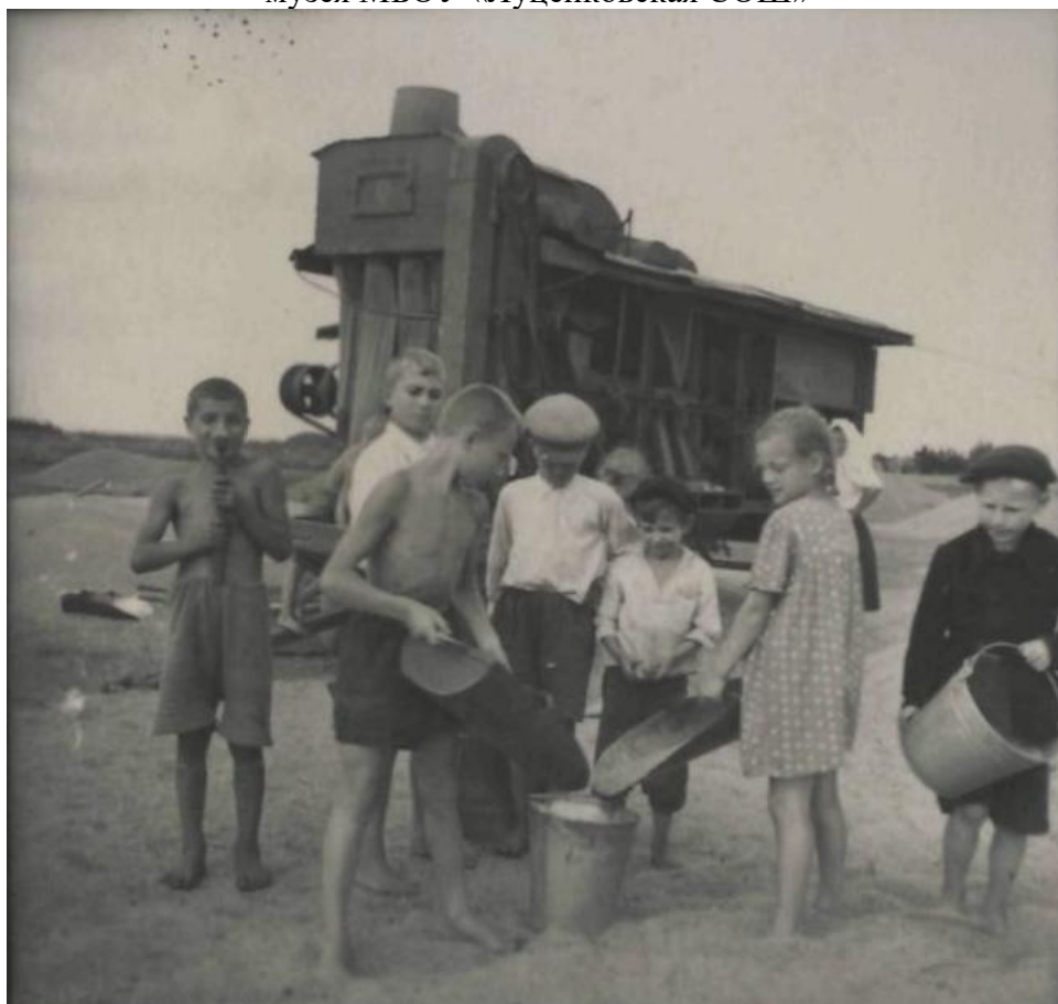
Подростки, работающие на току колхоза «Правда», 1953 г.