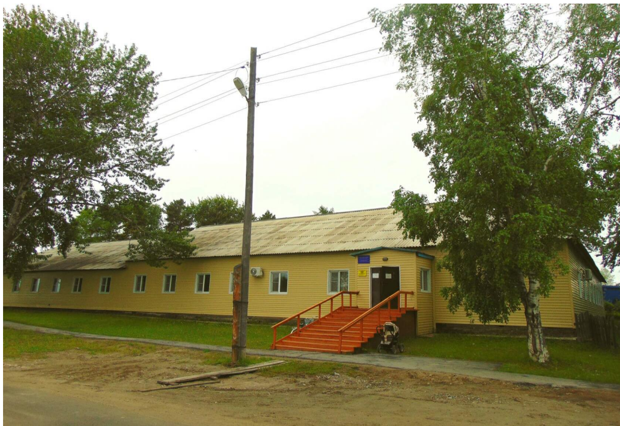
Здание больницы с.им. Полины Осипенко 2020г.

До 1918 года в этом здании размещалось управление и контора золотодобывающей компании. В этом здании прошел бескровный переход к Советской власти. Далее до 1937 года там был Исполком и в 1938 году это здание было передано под больницу.