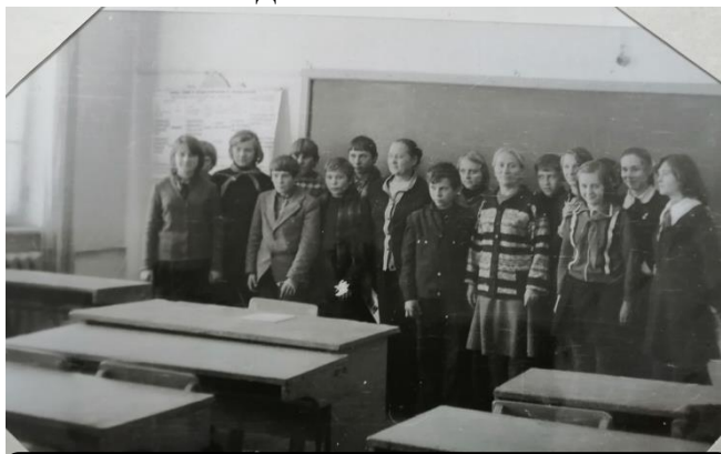
Встреча с учениками школы 1988 г.