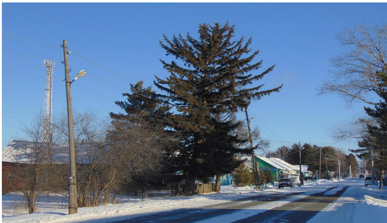
Центральная улица Амгуньская