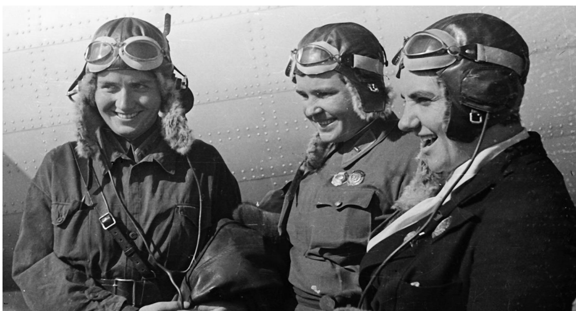
Марина Раскова, Полина Осипенко и Валентина Гризодубова, 1938 г.

Весь день 24 сентября экипаж летел над облаками и почти не видел землю. Маршрут прокладывался по радиокompасу. Радиостанции крупных городов поддерживали с экипажем радиосвязь. После пролёта Красноярска вышла из строя радиостанция, экипаж остался без связи. В 6 часов 52 минуты 25 сентября Москва получила с борта самолёта последнюю радиограмму. Слепой полёт продолжался. По расчётному времени самолёт «Родина» достиг побережья Охотского моря, но облачность не позволяла увидеть море. Над морем экипаж попал в разрыв облачности.