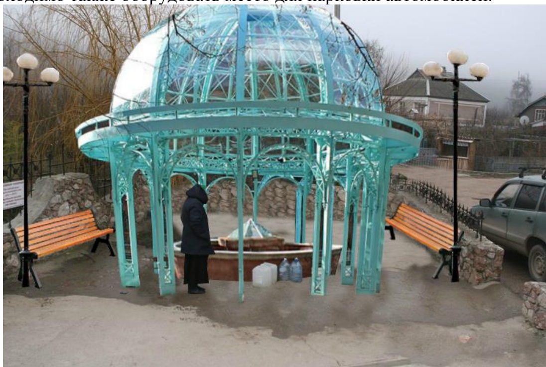
Источник в будущем

В моих мечтах облагородить территорию вокруг источника, чтобы люди смогли отдохнуть, укрыться от дождя и снега, ожидая своей очереди. Необходимо также оборудовать место для парковки автомобилей.