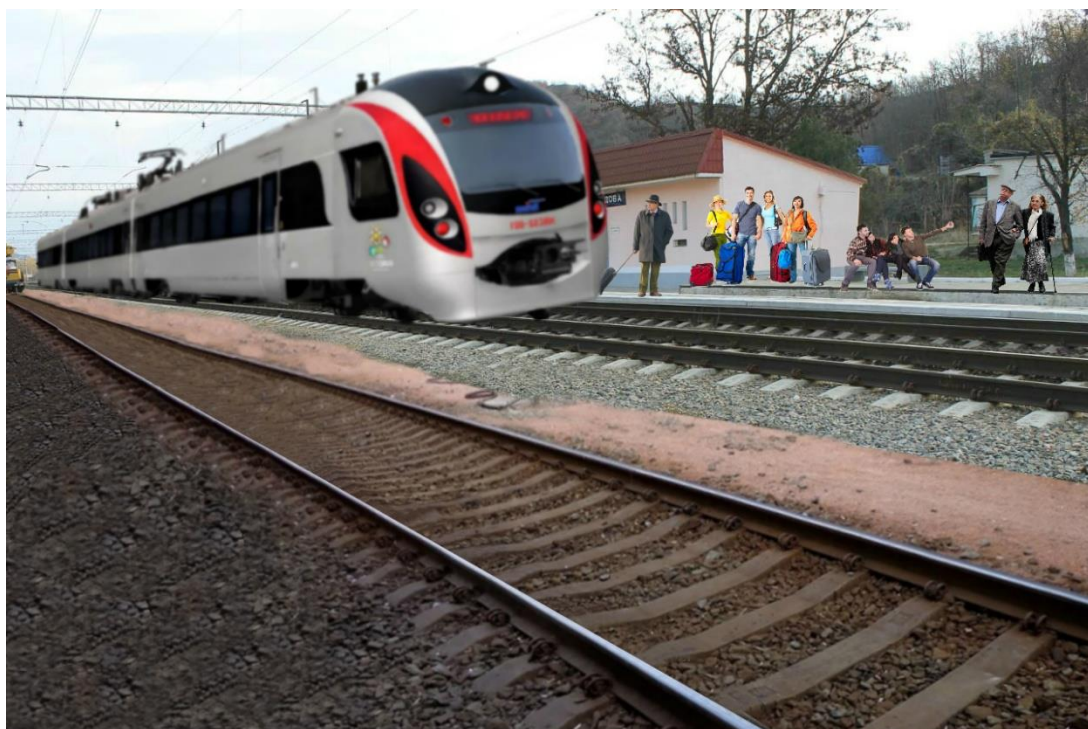
Станция «Верхнесадовая» в будущем

Но очень скоро будут проложены новые железнодорожные маршруты по Крымскому мосту, и модернизированные поезда начнут курсировать в Севастополь, останавливаясь на ожившей и преобразившейся станции «Верхнесадовая», где, как и в былые времена, проезжающие смогут купить свежие плоды, пахнущие солнцем, счастьем и детством.