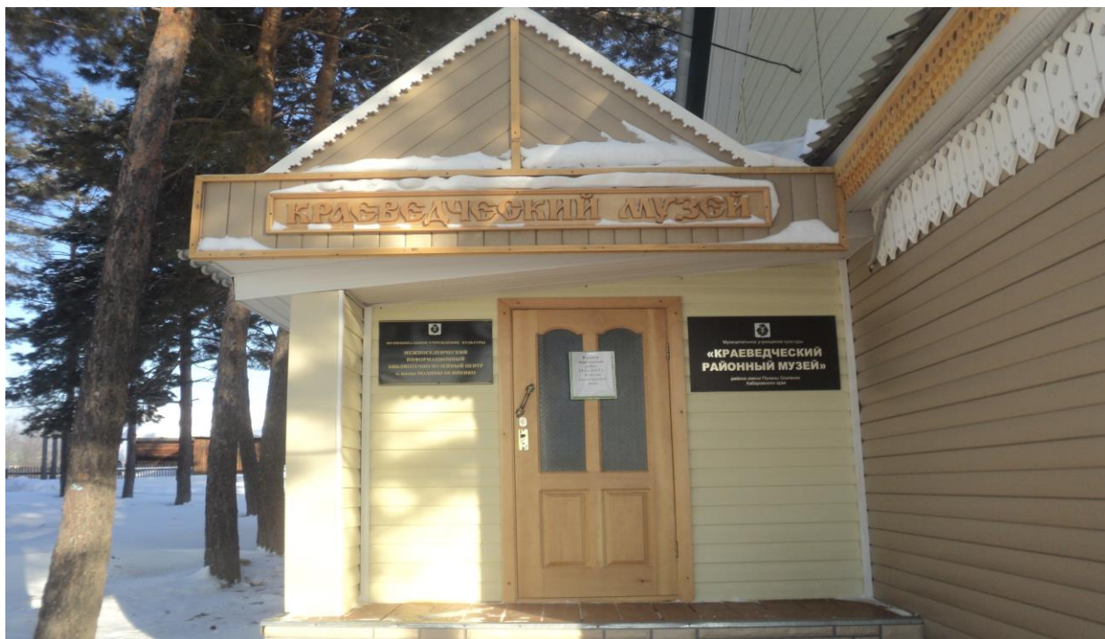
Краеведческий музей с.им. Полины Осипенко 2020г