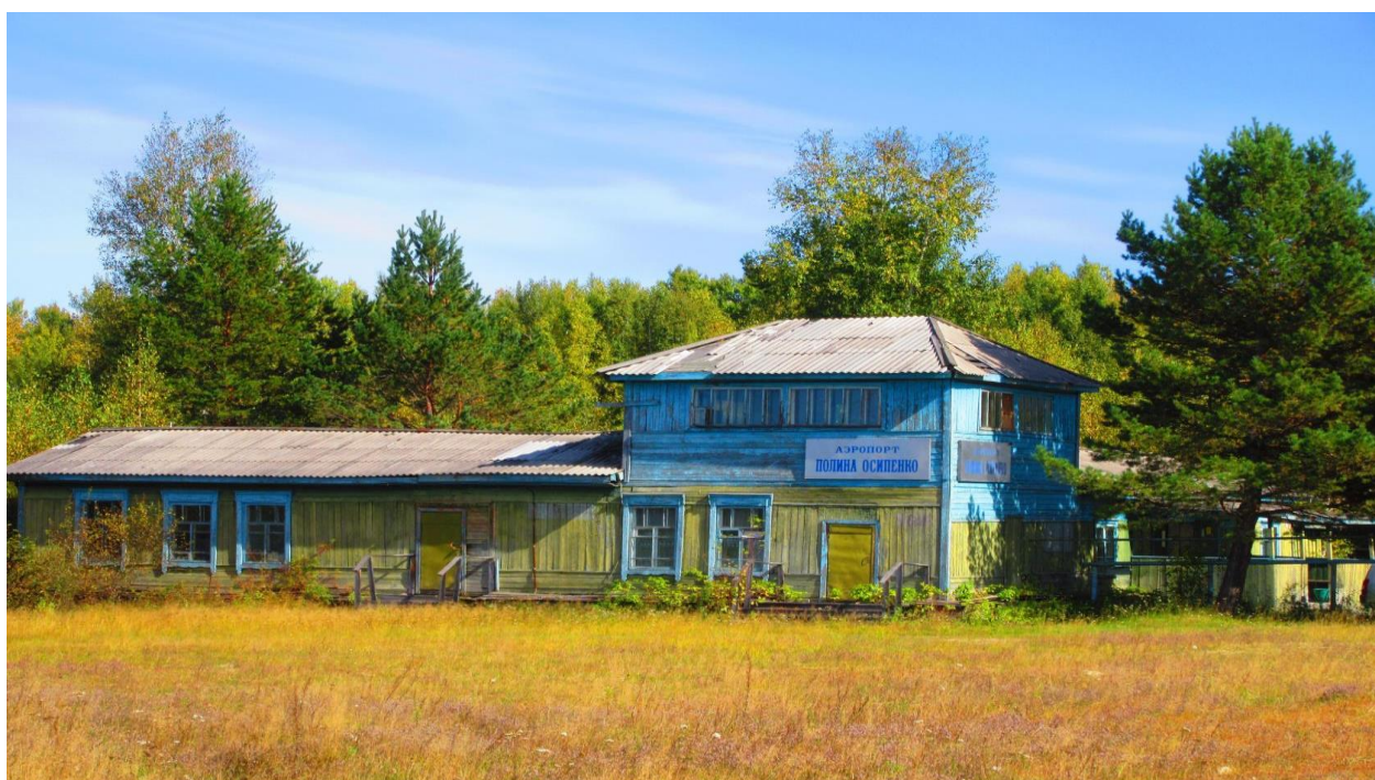
Недействующий аэропорт с.им. Полины Осипенко